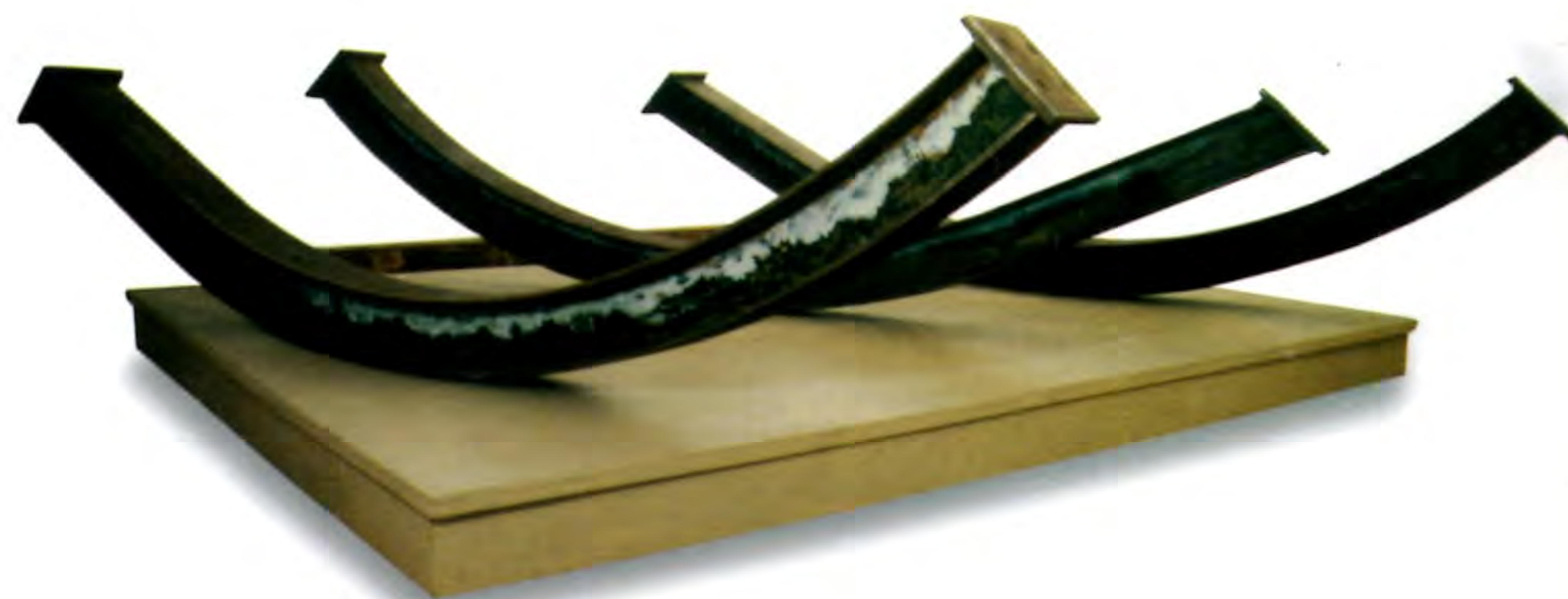
"Las Tres Gracias", 2000. Fierro soldado y aluminio fundido; 240 x 12 cms.