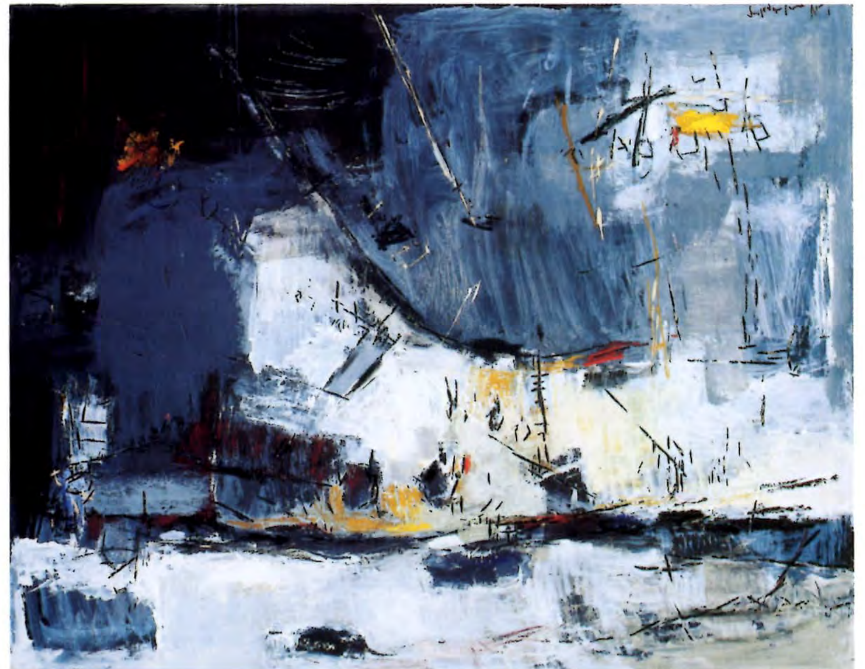
"Paisaje en Grises", 2000. Oleo sobre madera; 120 x 150 cms.

Licenciada en Arte, Mención Pintura, Escuela de Arte, Pontificia Universidad Católica de Chile. Ha expuesto en varias muestras individuales y colectivas, tanto dentro como fuera de Chile; como por ejemplo en la muestra "El Tarot", Galería Isabel Aninat, 1999; en el Museo Pedro de Osma, "Pintando con los Niños", Lima, Perú, 1998 y en la Galería Paulina Rieloff, en Nueva York, en la muestra "New York on My Mind", 1997. Entre sus distinciones se encuentran el "Premio Alcatel", Amigos del Arte 1998 con el que viaja a París; "Beca Amigos del Arte", 1997; Primer Premio Concurso "Los Jóvenes Pintan la Paz", Embajada de Israel, Santiago de Chile con el que viaja a Israel y Medio Oriente y la "Beca de Honor", premio a la excelencia académica, Pontificia Universidad Católica de Chile, 1992-1991.