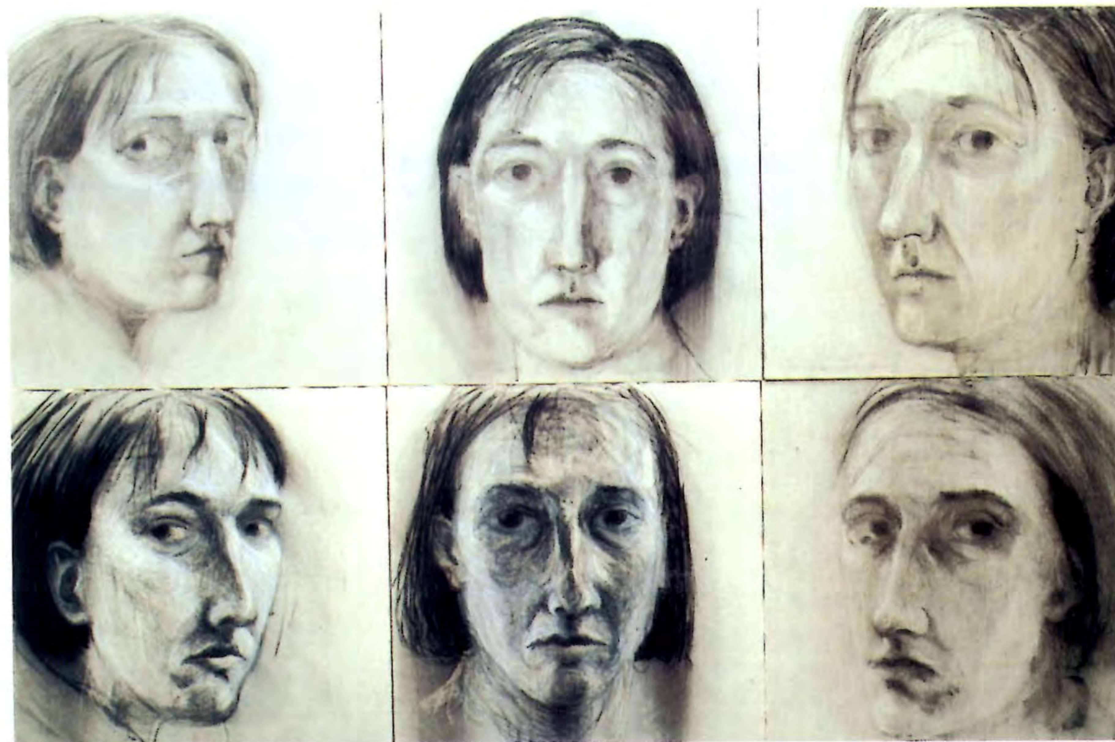
"Autorretrato", Políptico, 2001. Carbón sobre tela, módulos de 100 x100 cms.

Licenciada en Arte con Mención en Pintura de la Universidad Católica de Chile. Ha realizado cursos en la Universidad La Sabana, Colombia y Special Studies at Emily Carr School of the Art and Design, en Vancouver, Canadá. Ha participado en varias muestras colectivas e individuales, tanto en Chile como en el extranjero: en el Museo de Arte Contemporáneo de Valdivia, Chile; en el Museo Nacional de Bellas Artes, Santiago, Chile; en el Karya Diplomat Dalam Dan Luar Negeri, Jakarta, Indonesia y en el Claudia Cuenta's Alternative Gallery, Vancouver, Canadá.