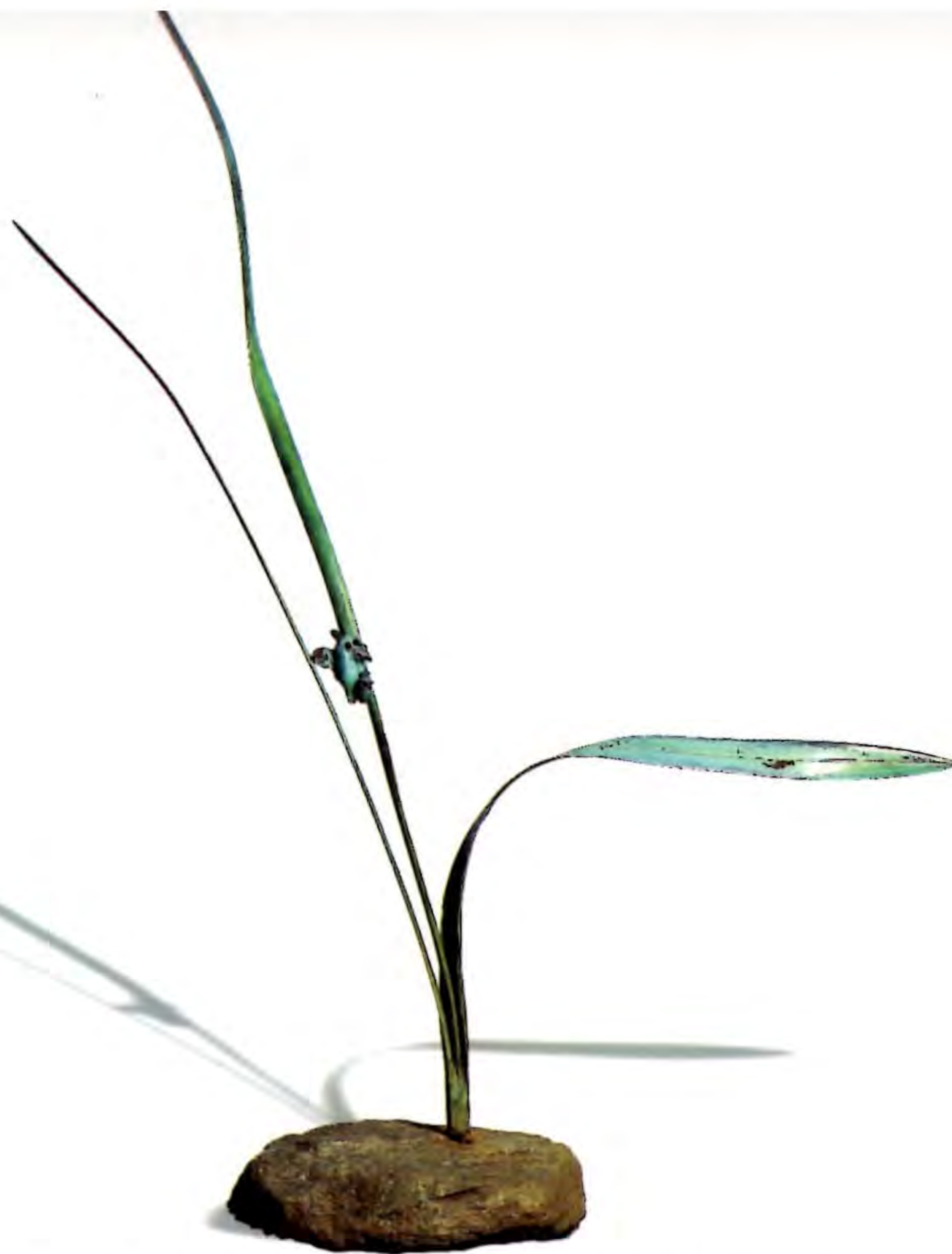
"El Pájaro de los Ojos Verdes", 2000. Bronce forjado, bronce fundido a la cera, piedra y piedra pizarra; 100 x 100 x 165 cms.

Licenciada en Arte con Mención en Escultura de la Universidad Finis Terrae. Ha participado en varias exposiciones colectivas, como por ejemplo: "Arte 8", Valle Escondido, 2000; "Inauguración Centro para la Juventud", Municipalidad de Providencia, 2000; "Escultores Jóvenes en Arica", Colección Artespacio, 2000 y "Siete Artistas Jóvenes de la Plástica Nacional", Museo Arte Moderno de Chiloé. En el año 2000 obtiene el Tercer Lugar en el Primer Concurso Fundación Telefónica, "Escultura Joven".