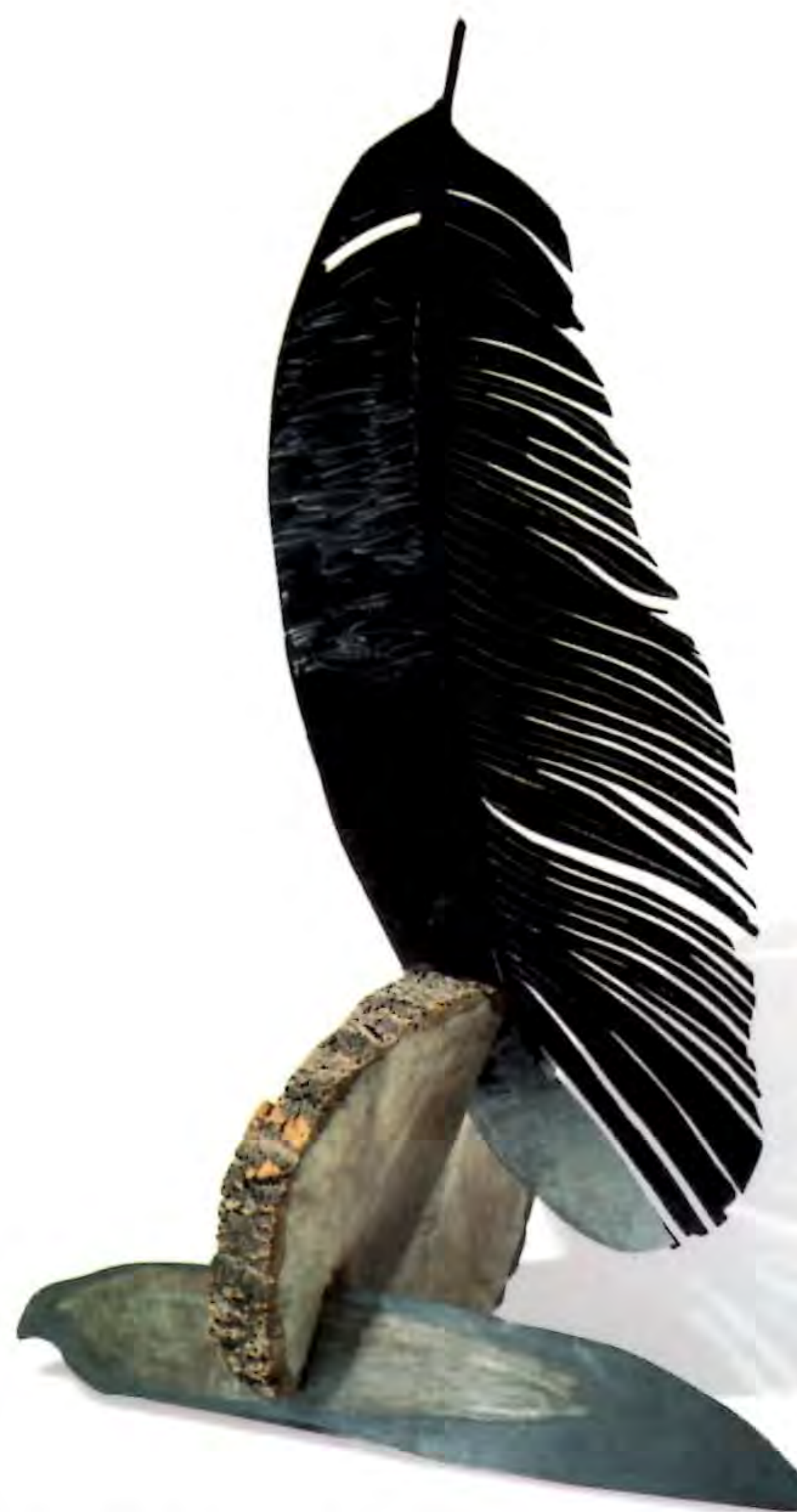
"Sin Título", 2000. Resina, fierro y madera; 220 x 120 x 120 cms.

Fondart para la realización de siete esculturas en fierro de mediano formato, 1997; Primer Premio Concurso "Escultura Joven Chilgener", Parque San Borja, Santiago, 1996. También participa en dos equipos de escultores que ganan el Primer Lugar en el "Concurso para Edificios y Espacios Públicos" de la Comisión Nemesio Antúnez y el MOP -obras instaladas en Coyhaique, Los Muermos, Castro y Quellón-.