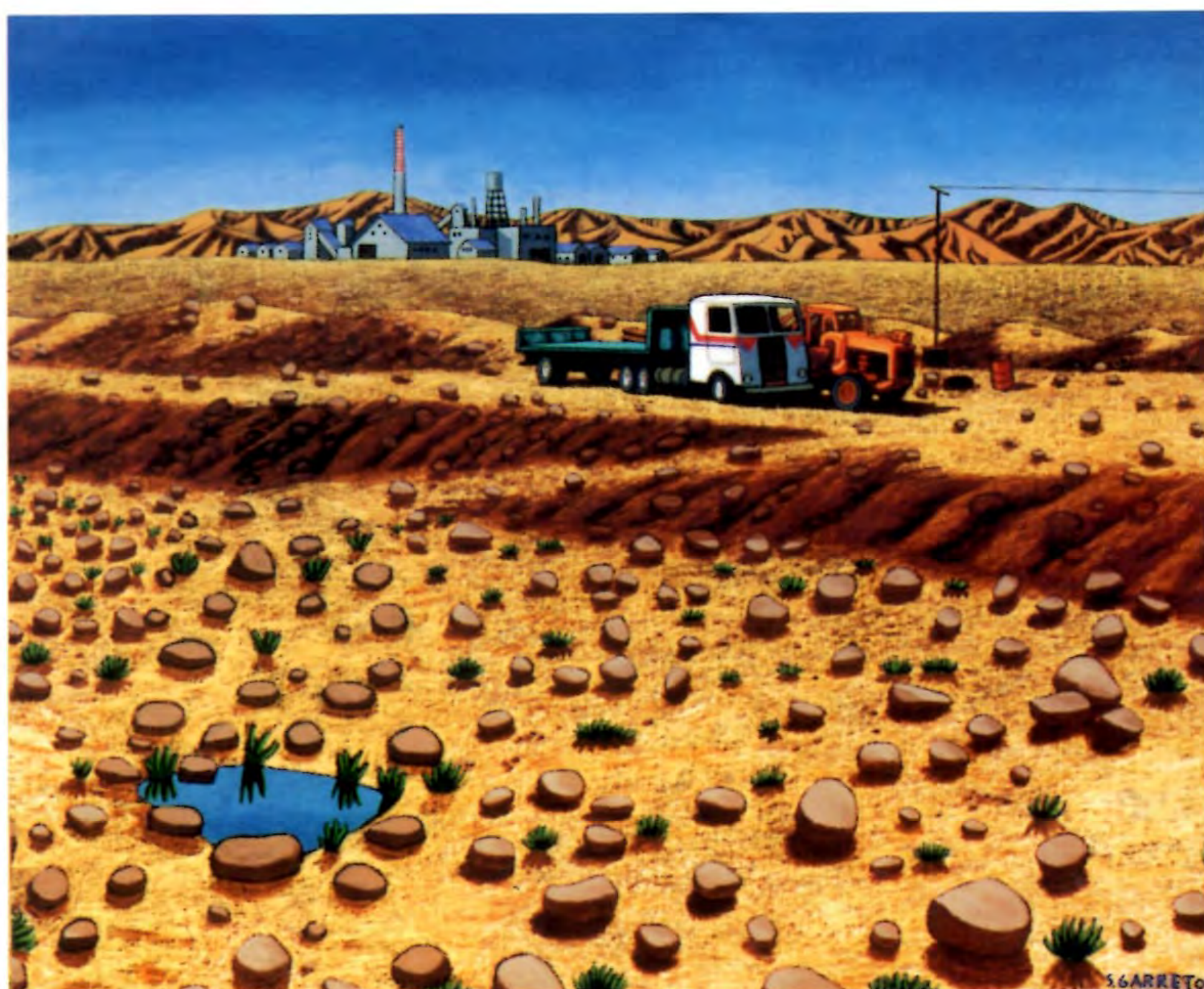
"Sin Título", 2000. Oleo sobre tela; 163x135 cms.

Realiza sus estudios de Licenciatura en Arte en la Universidad Católica. Se acerca a la realidad de manera lúdica, imaginativa y fantástica. Los colores interactúan, produciendo vitales composiciones donde el paisaje chileno es el protagonista. En 1998 gana un concurso para la realización de un Mural de la ACHS. En 1997 obtiene el Primer Premio en el Concurso "El Color del Sur", Puerto Varas; en 1995 recibe el Primer Premio en el Concurso "Marco Bontá"; en 1993 el Primer Premio del Concurso "Lluvia de Pinceles" del Museo de Arte Moderno de Chiloé y en 1987 gana el Primer Premio en la Iª Bienal de Arte Universidad Santiago - París.