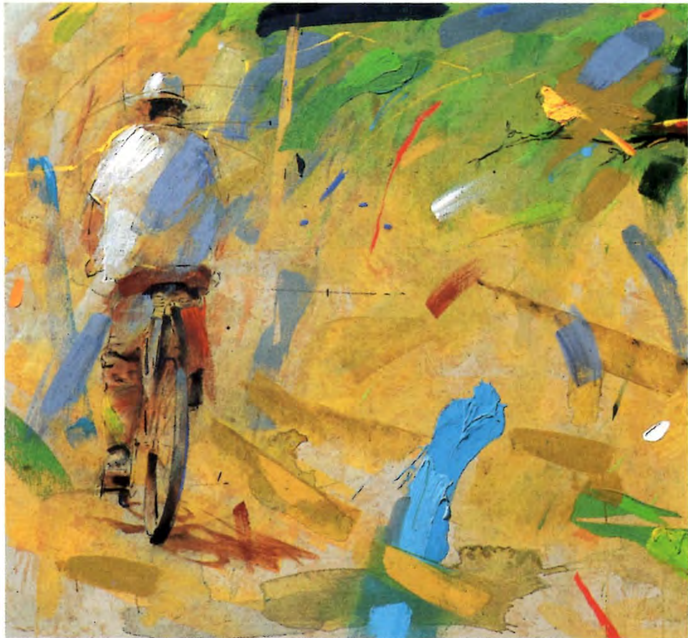
"El Ciclista", 2001. Técnica mixta sobre tela; 140 x140 cms.