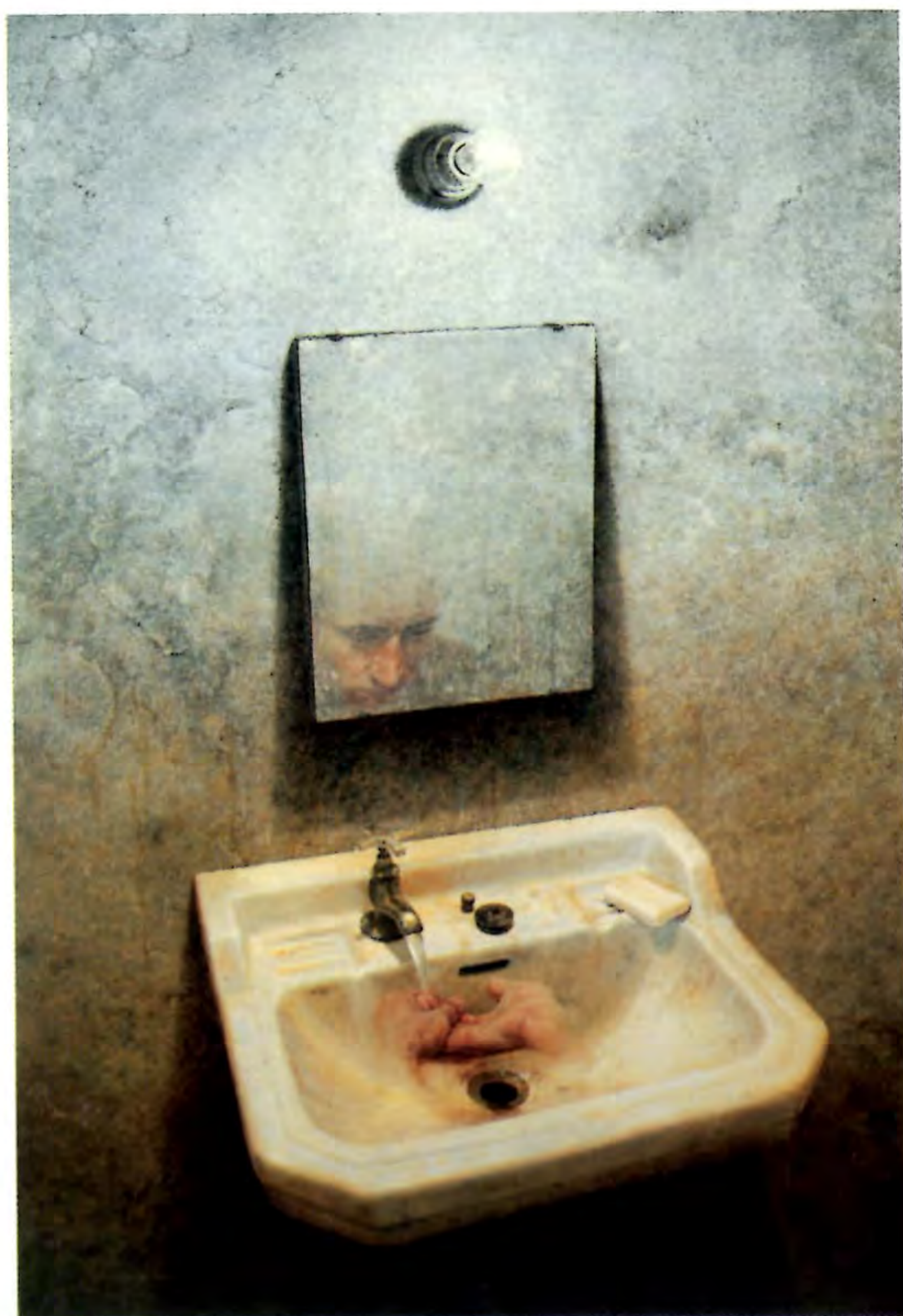
"Autorretrato", 1999. Oleo sobre tela; 125 x 85 cms.

Licenciado en Arte de la Universidad Católica de Chile. Ha expuesto en muestras colectivas e individuales dentro de Chile, como en la Galería Isabel Aninat, 2000; en la Galería del Hotel Plaza San Francisco en la muestra "Jóvenes Realistas en el Día de Hoy", 1996 y en el Instituto Cultural de Providencia en la muestra "El Taller del Pintor", 1995. Ha obtenido premios tales como el Tercer Lugar en el Concurso "Nescafé en el Arte", Galería Isabel Aninat, 1998 y el Segundo Lugar en el "Concurso Nacional de Pintura Juvenil", Laboratorio Chile, 1987.