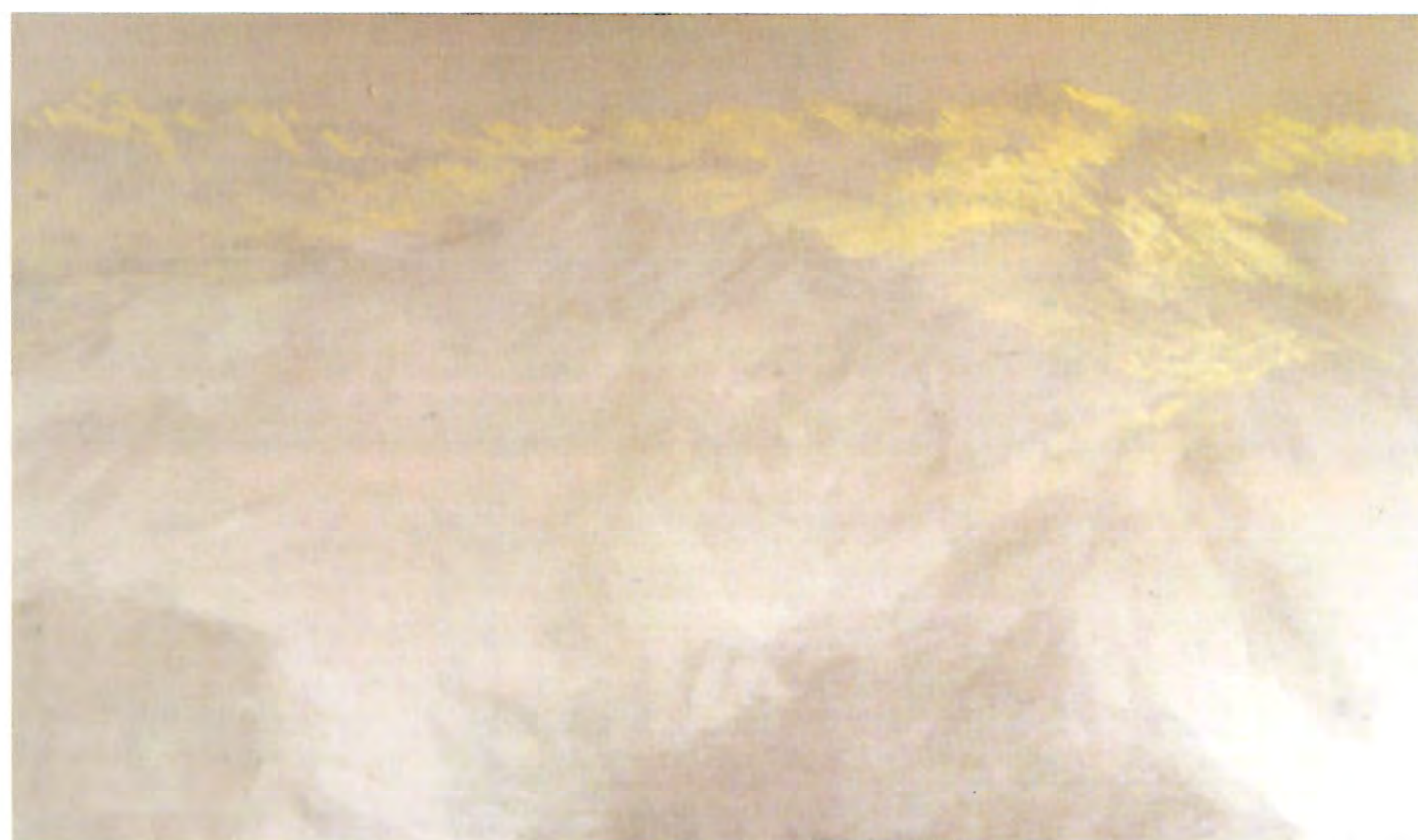
"Sin Título", 2001. Oleo sobre tela; 114 x 195 cms.