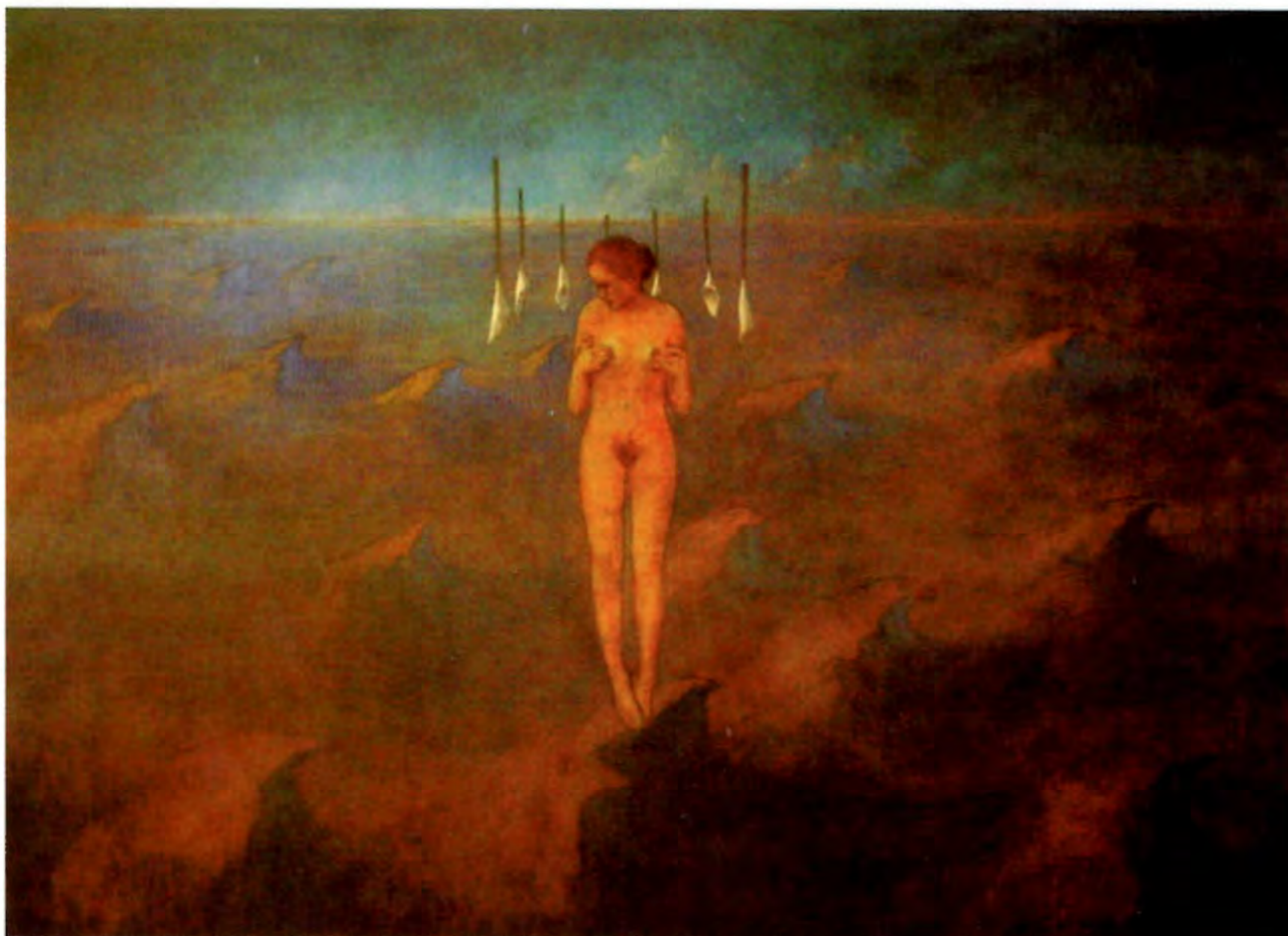
"La Santa de las Olas de Piedra", 2000. Acrílico sobre tela; 150 x 200 cms.

Estudió Arquitectura en la Universidad Católica de Valparaíso y Licenciatura en Arte en la Universidad de Chile. Sus obras lo han llevado a exponer en Chile y en la John Oulman Gallery, Minneapolis, EE.UU., en 1998. Ha obtenido importantes distinciones como la Beca Amigos del Arte, 1998; Primer Lugar en el Concurso "Mural", Asociación Chilena de Seguridad, 1999; Mención Honrosa en la Bienal de Buenos Aires 2000 y el Primer Lugar en el Concurso Enersis, "Energía y Luz", 2000.