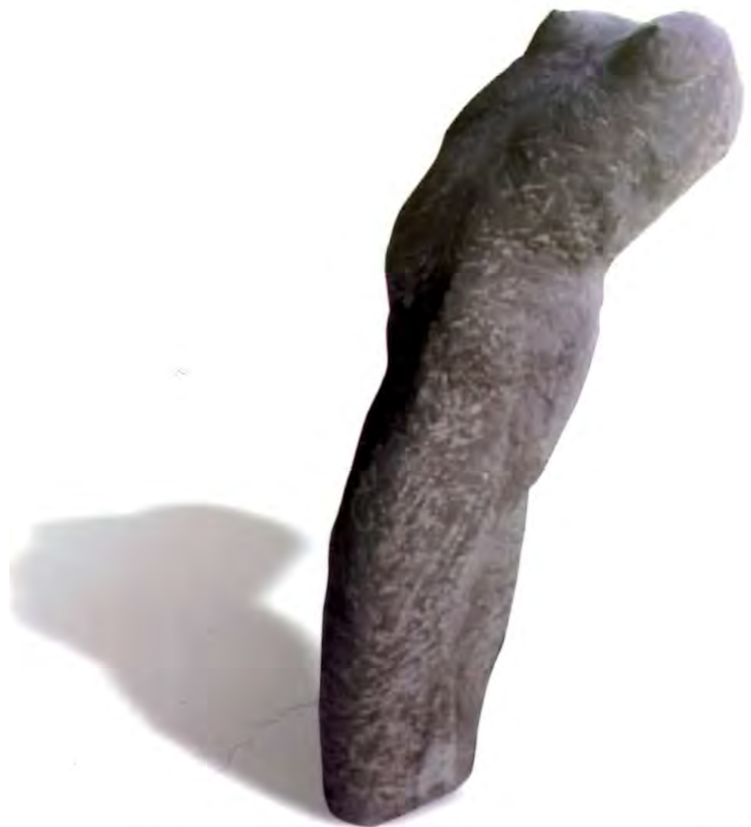
"Pierna II", 1997. Cemento, cuarzo, fibra de vidrio y pigmento; 126 x 60 x 58 cms.

Realizó estudios de Pedagogía Media en Artes Plásticas y Licenciada en Arte con Mención en Escultura de la Pontificia Universidad Católica de Chile. En 1987 realizó estudios de Pintura, Dibujo y Escultura con los maestros Eva Lotz y Santiago Cárdenas en el círculo de Bellas Artes de Madrid, España. Ha expuesto en varias exposiciones individuales y colectivas, tanto fuera como dentro de Chile. Entre sus distinciones se encuentran la Beca Workshop con el escultor Waldemar Otto, Campus del Comendador, Pontificia Universidad Católica de Chile, 2001.