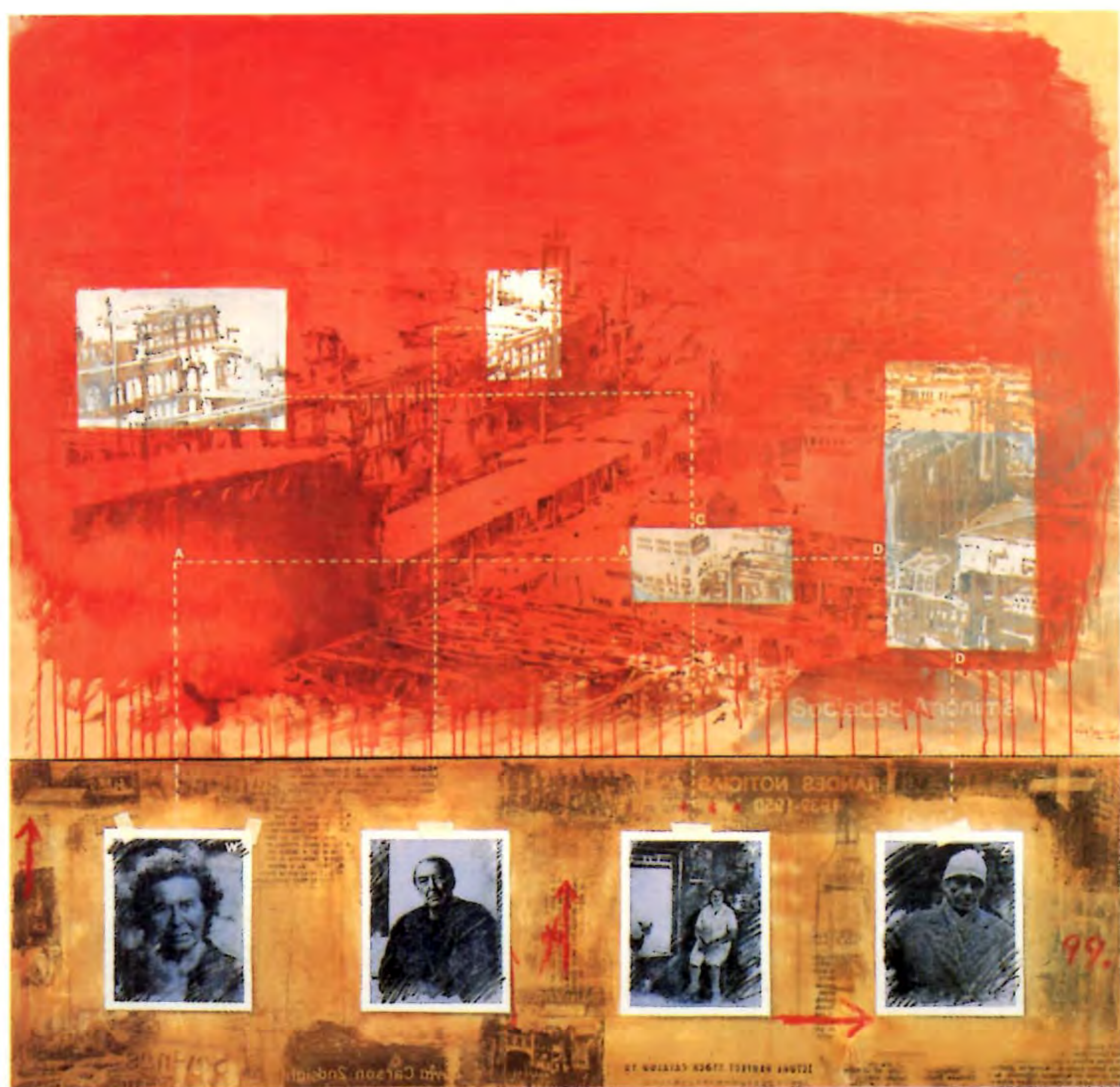
"Sociedad Anónima", 1999-2000. Técnica mixta sobre tela; 145 x 150 cms.

Estudió Arquitectura en la Universidad Finis Terrae; Pintura en la Parsons School of Design, y Grabado en la School of Visual Arts, en Nueva York. Su obra conlleva una coherente y rigurosa evolución, dentro de un hacer que partió de lo figurativo, con elementos surrealistas y que últimamente apunta hacia una síntesis donde entra en juego el neorrealismo, junto a elementos del informalismo, del arte conceptual y del pop art, predominando lo matérico y objetual. Incorpora asimismo, la fotografía, el diario, el collage y la escritura, en superficies de color que conviven con brochazos y símbolos. Entre sus reconocimientos se encuentran el Primer Lugar en la "Bienal de Dibujo", Santo Domingo, República Dominicana, 1998 y el Segundo Lugar en el Concurso "Pintura Joven", St. Louis, Estados Unidos, 1985.