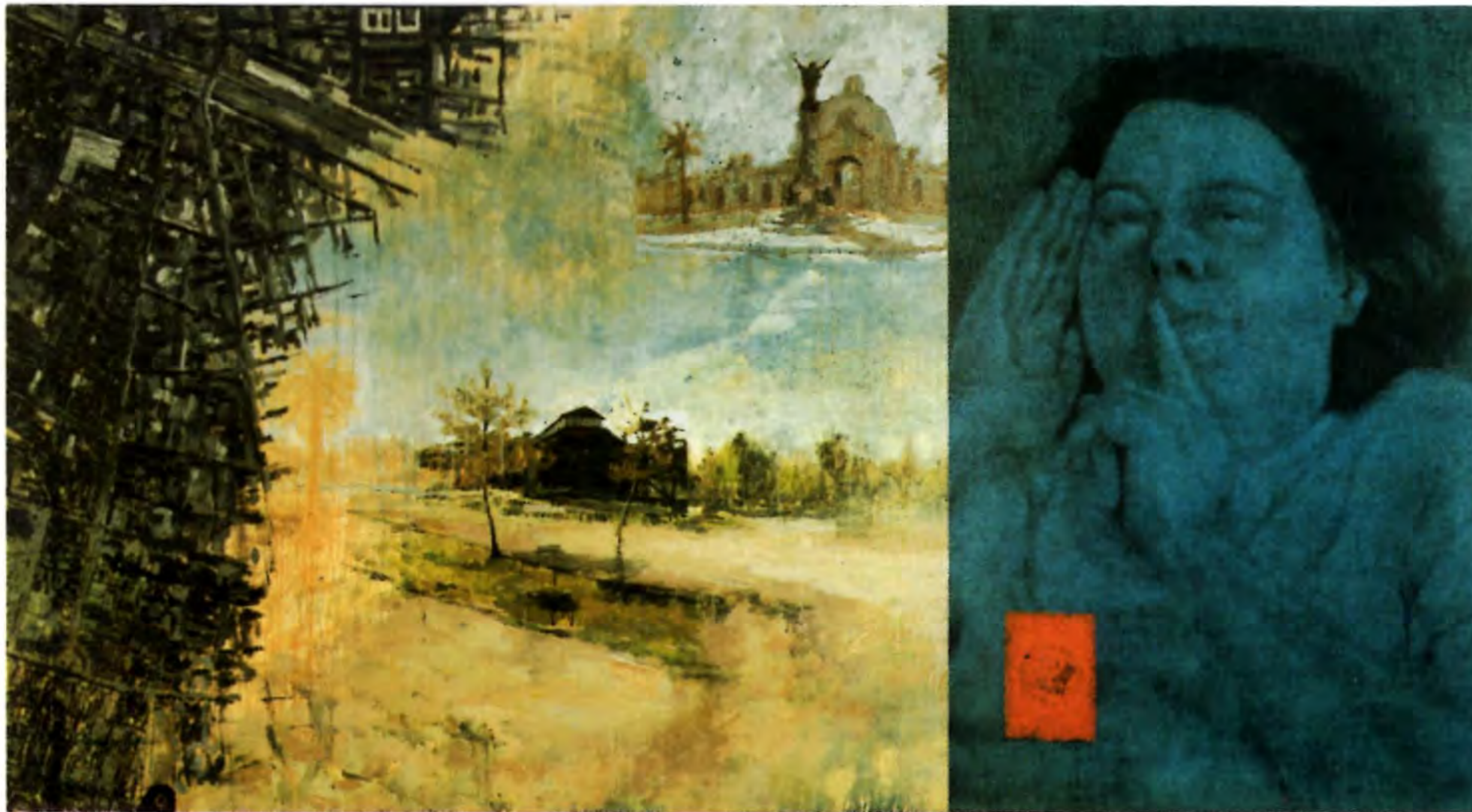
"Sin Título", Díptico, 1999. Carbón, óleo e impresión digital sobre lino; 160 x 300 cms.