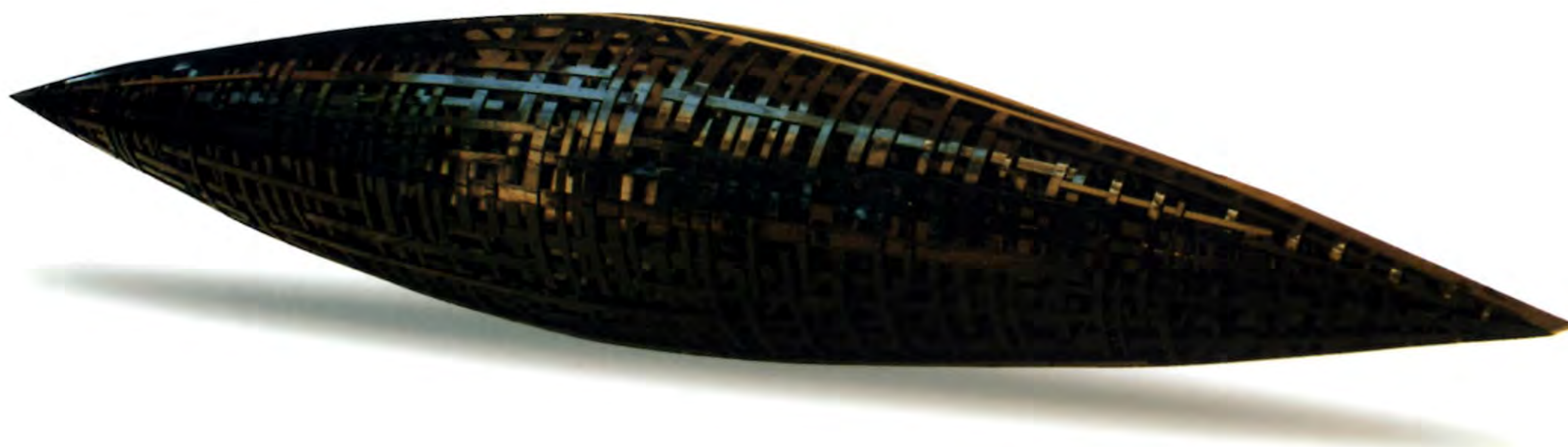
"Objeto Negro", 1996. Acero y pintura electrostática; 350 x 45 cms.

Licenciado en Bellas Artes con Mención en Escultura de la Universidad Arcis. Ha participado en varias exposiciones individuales y colectivas tanto dentro como fuera de Chile, como por ejemplo: "El Encuentro Nacional de Escultores", Casa del Cabildo, La Reina, 2000; Museo de Arte Moderno de Chiloé (M.A.M.), 2000 (muestra individual); "Paradero Diferido, Ejercicio 001", Centro Cultural de España, 1998 (muestra individual) y "Sculptures Internationals", Galería de Arte Le Portal, Québec, Canadá, 1998. Entre sus reconocimientos destacan el Primer Lugar en el Concurso "Escultura Joven", Fundación Telefónica, 2000; Mención Honrosa en el Concurso "Homenaje al Viento", Ministerio de Obras Públicas, 1999; Premio Fondart, 1999; Beca Amigos del Arte, 1999 y el Tercer Lugar en el Concurso "Matisse", Instituto Chileno- Francés de Cultura, 1991.