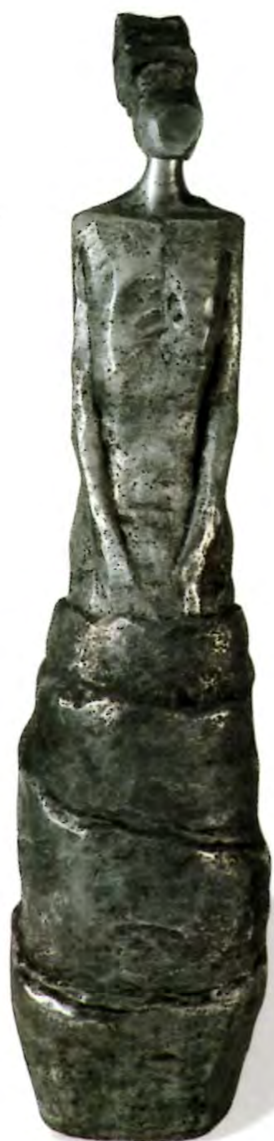
"Mangosta", 2001. Aluminio fundido; 200 x 80 cms.

Licenciada en Arte con Mención en Escultura de la Universidad de Chile. Ha expuesto en varias exposiciones colectivas e individuales, como por ejemplo: "Entre Nidos y Colmenas", Galería Palma-Valdés, 2001 (exposición individual); Concurso "Escultura Joven", Sala Fundación Telefónica, 2000 y en el "Segundo Encuentro Nacional de Escultores", año 2000. Ha obtenido las distinciones del Fondart en dos ocasiones; para el proyecto "Paisaje", Ministerio de Educación, 1996 y "Alegoría a los Siete Peldaños", Ministerio de Educación, 1994.