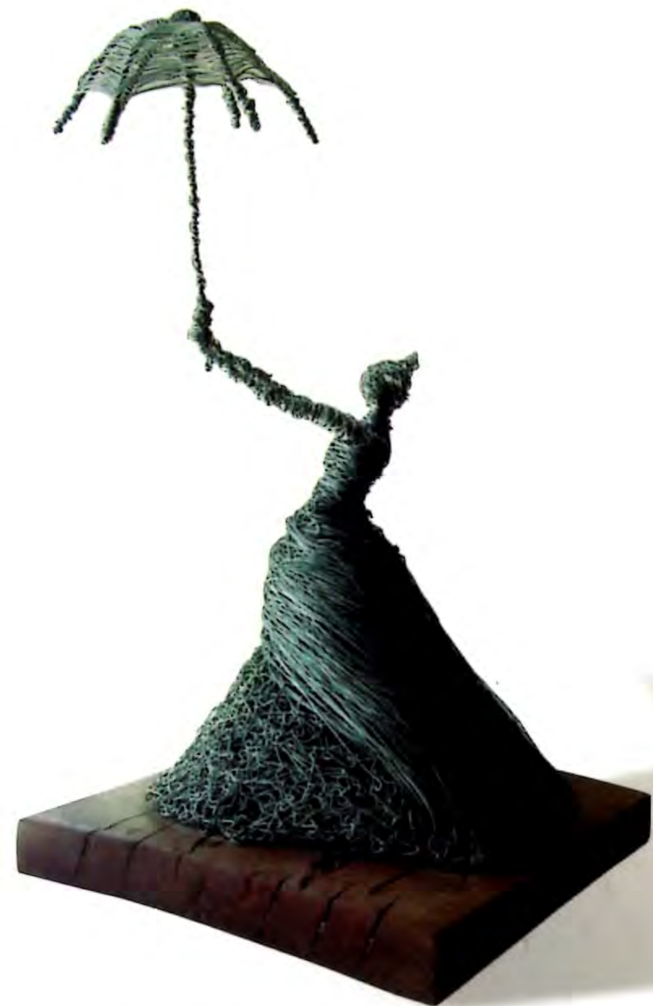
"Viento de Gala", 2001. Alambre; 1,70 x 65 x 65 cms.